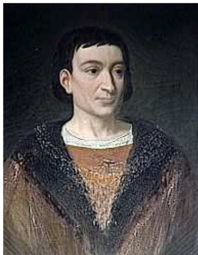
Charles VI de France par Jean Du Tillet. Recueil des rois de France - Bibliothèque nationale de France.

Durant la première partie de la guerre de 100 ans, les Anglais obtiennent de nombreuses victoires contre les Français. Charles V, aidé de Bertrand Du Guesclin (voir fiche) récupèrera petit à petit l'essentiel des territoires conquis par les anglais.