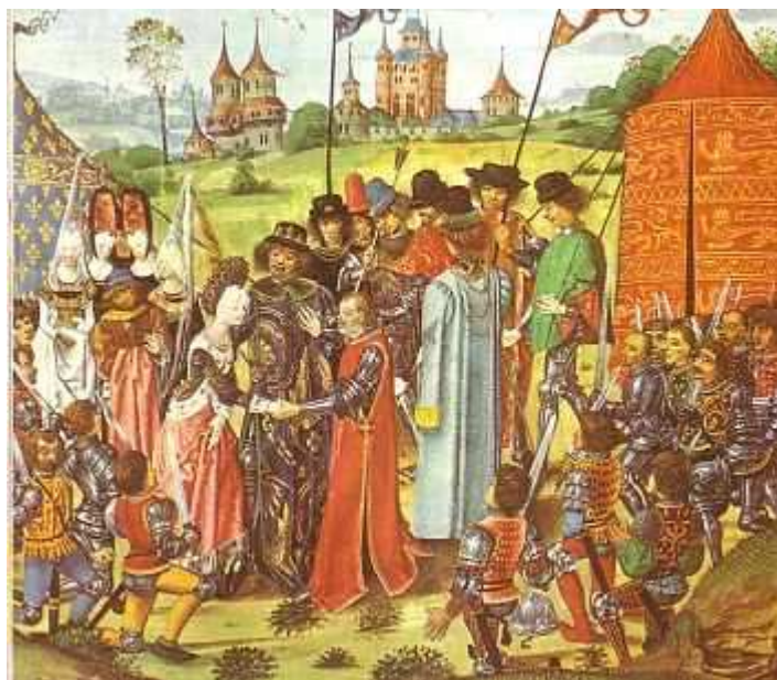
Mariage d'Henri V et de Catherine de Valois Et bataille d'Azincourt

Henri V, roi d'Angleterre, profite de ces troubles, et attaque la France : il remporte la bataille d'Azincourt en 1415. Il s'empare de la Normandie.